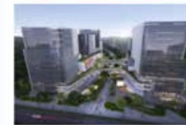
인터파크 사옥 & 스타트업 캠퍼스