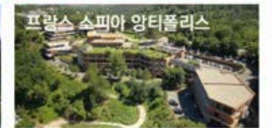
지방정부 & 입주기업으로 구성된 자발적 협의체를 통해 기업간 상호 협력