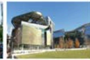
(미국) 코넬 테크