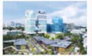
(싱가폴) 램치 파드